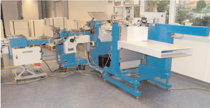
Ergebnis eines gemeinsamen Projekts: Die GUK-Falzmaschine für spezielle, kleingefaltete und verschleißbare Packungsbeilagen für die Pharmaindustrie.