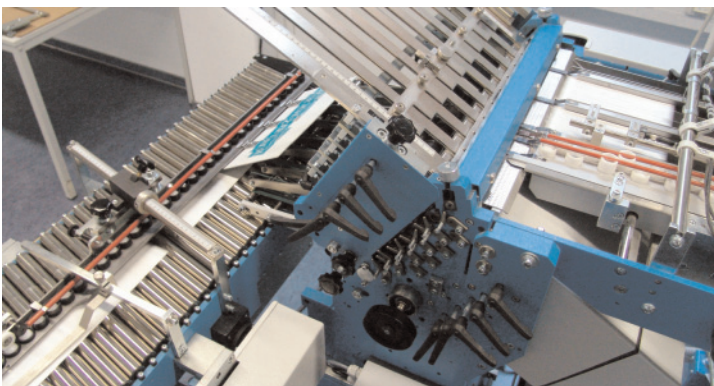
Die GUK-Falzmaschine mit zehn Falztaschen und Wassernutung vom ersten zum zweiten Falzwerk, die einen Aufbau an den Falzbrüchen verhindert.

Vochezer hatte sich von der verlässlichen, robusten Technik der