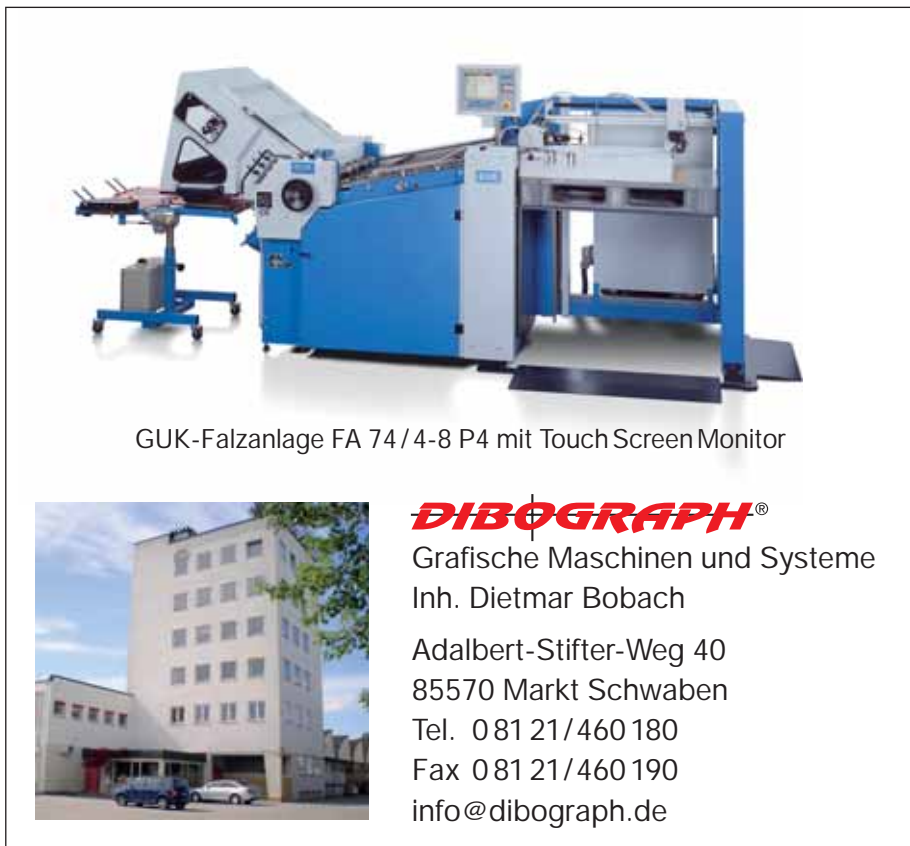
GUK-Falzanlage FA 74/4-8 P4 mit Touch Screen Monitor

Vochezer Druck GmbH Tel. 086 69 / 86 17-0 Dibograph® Grafische Maschinen und Systeme Tel. 081 21 / 460 180 info@dibograph.de