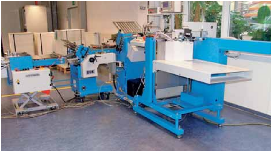
Ergebnis eines gemeinsamen Projekts: Die GUK-Falzmaschine für spezielle, kleingefaltete und verschleißbare Packungsbeilagen für die Pharmaindustrie.